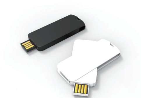
【フルカラー印刷イメージ】