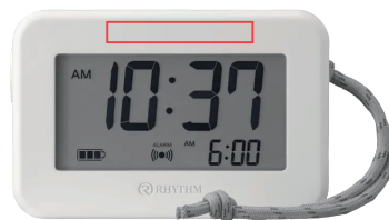
前面上部 H7 x W80mm