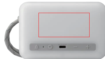
裏面 H35x W90mm